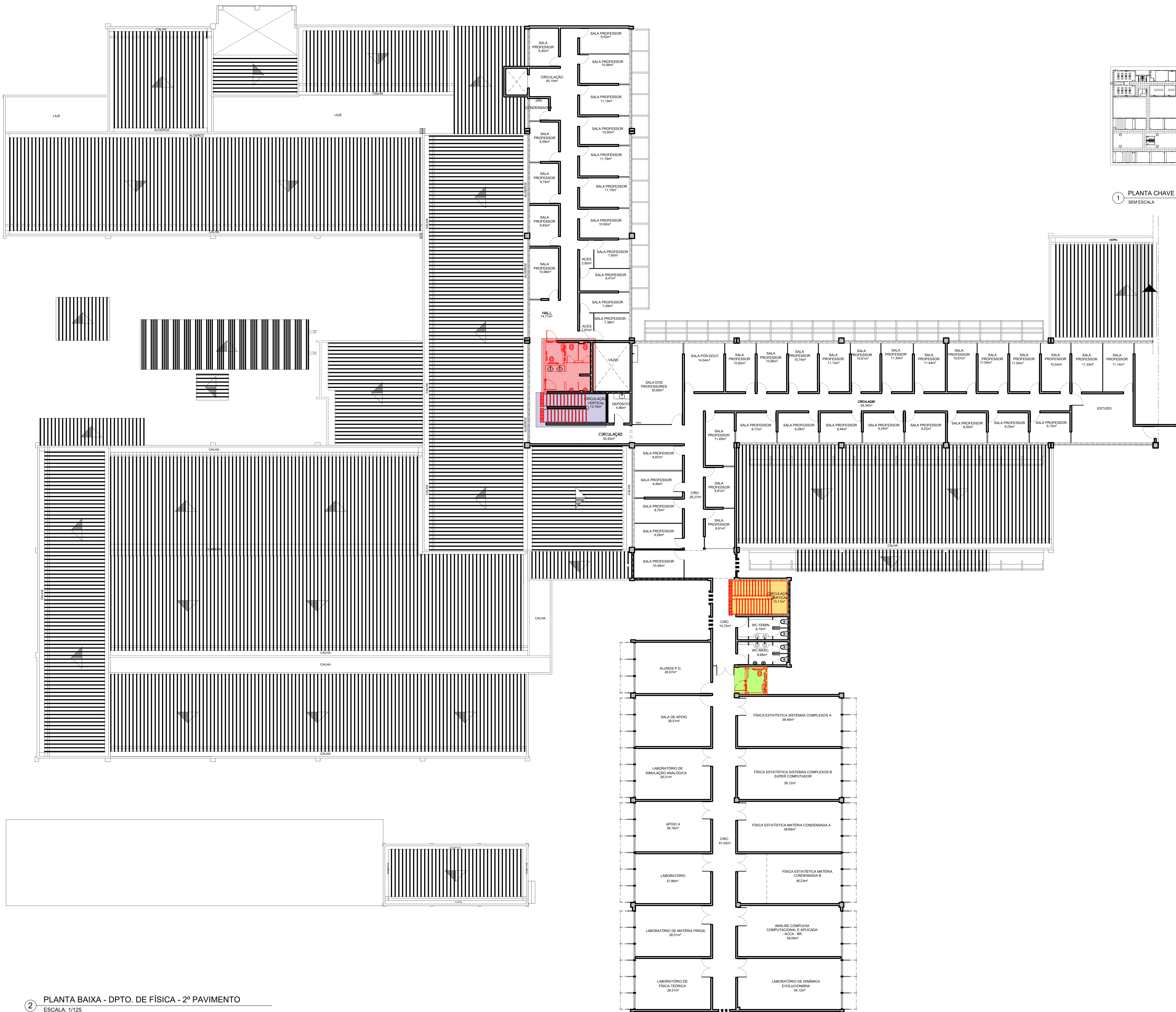
1 PLANTA CHAVE - CCEN SEM ESCALA